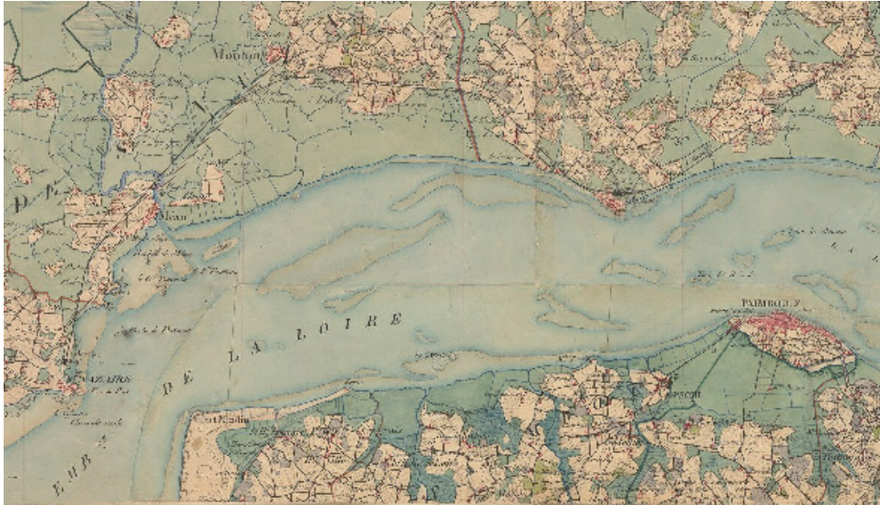
Ancienne Carte d'Etat-major de l'Estuaire de la Loire, source Géoportail

Enfin, un autre rendez-vous sera fixé en fin d'année pour présenter les premiers résultats d'Adapto et valoriser les éléments historiques qui auront pu être récoltés. Ce temps sera également l'occasion de partager de manière plus approfondie la démarche mise en place de ce projet innovant.