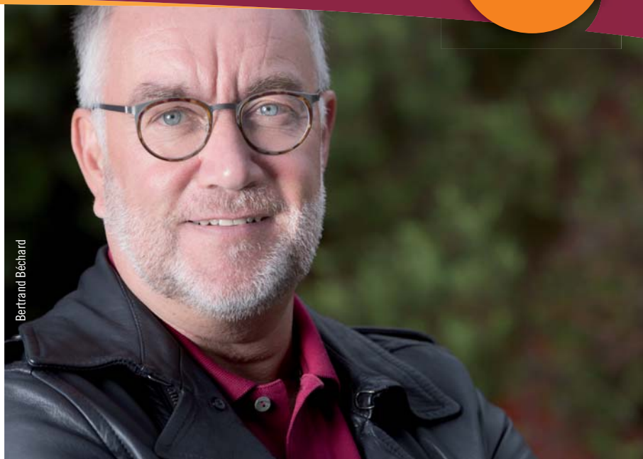
Yannick Morez, Président de la Communauté de Communes Sud Estuaire