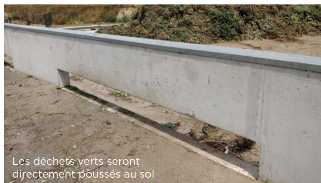
Les déchets verts seront directement poussés au sol