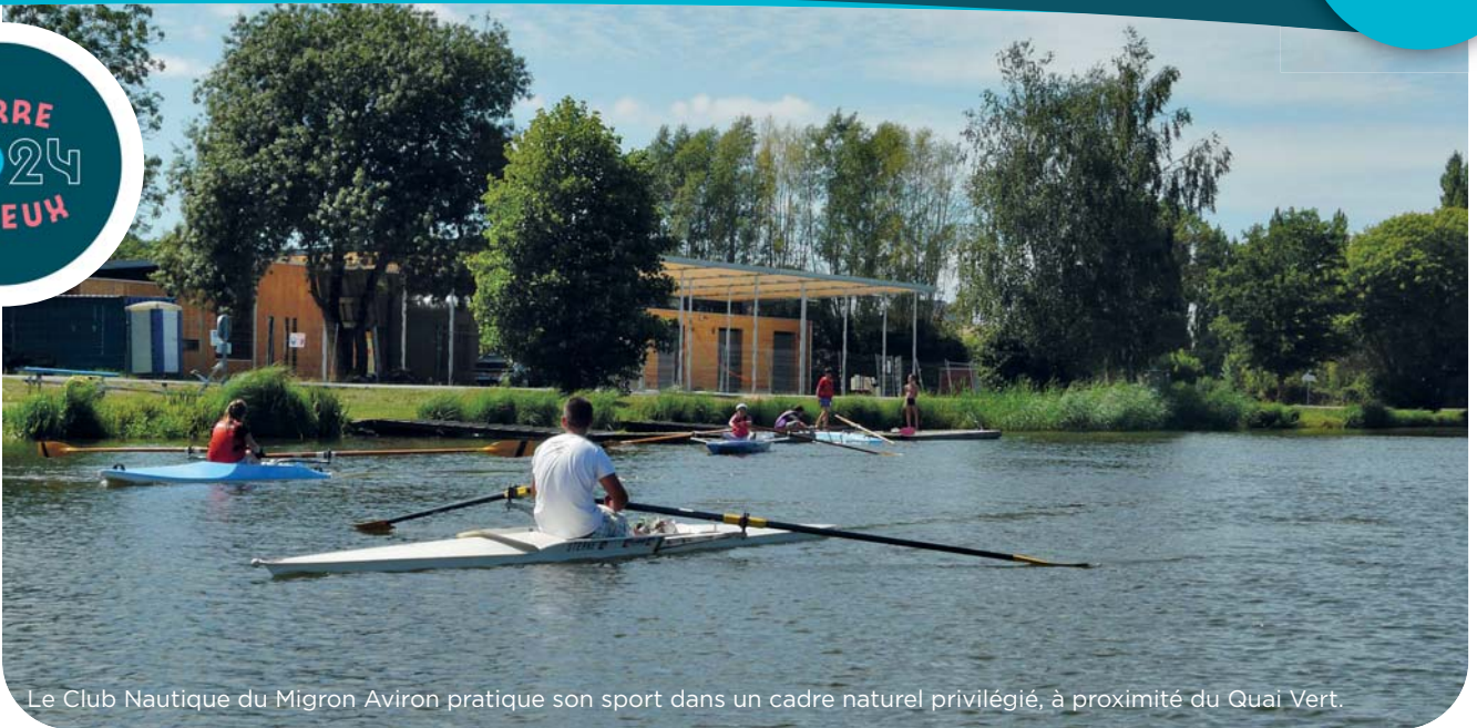
Le Club Nautique du Migron Aviron pratique son sport dans un cadre naturel privilégié, à proximité du Quai Vert.