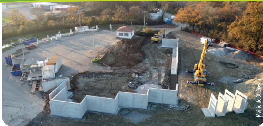
Mairie de St-Brevin