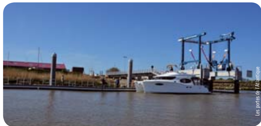
Les portes de l'Atlantique