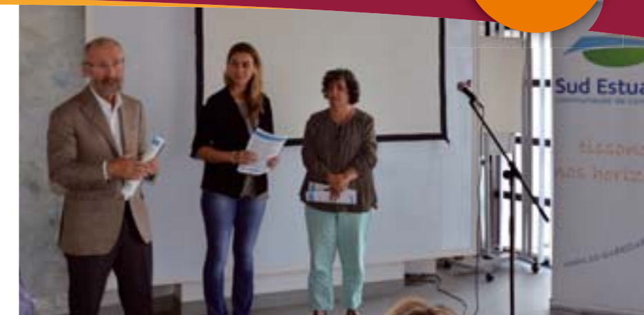
Yannick Haury, Président de la Communauté de Communes Sud Estuaire