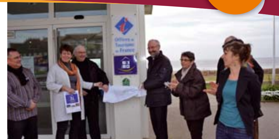
Yannick Haury, Président de la Communauté de Communes Sud Estuaire