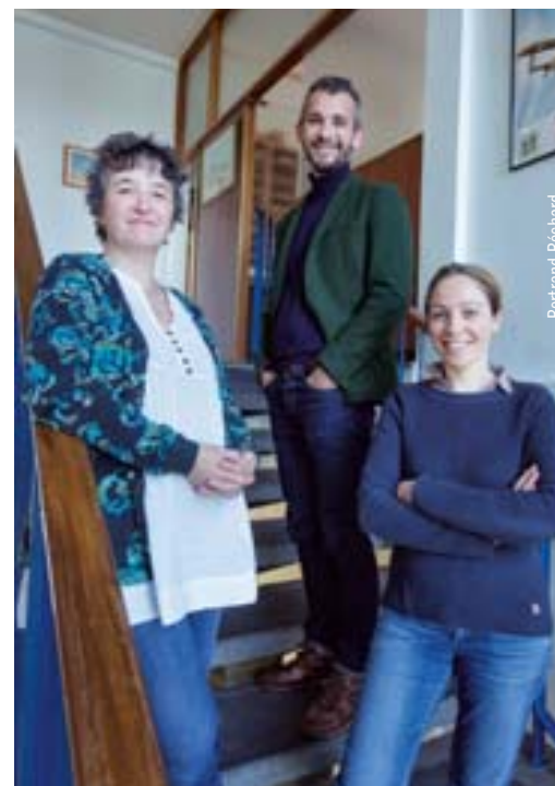
L'équipe du PETR