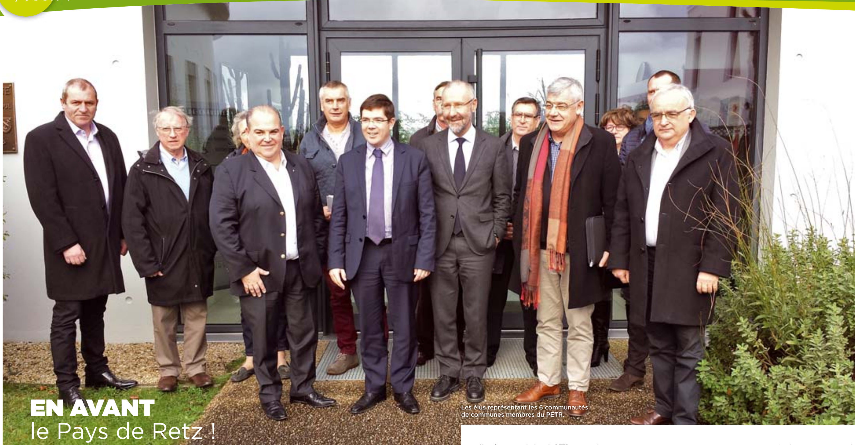
Les élus représentant les 6 communautés de communes membres du PETR.