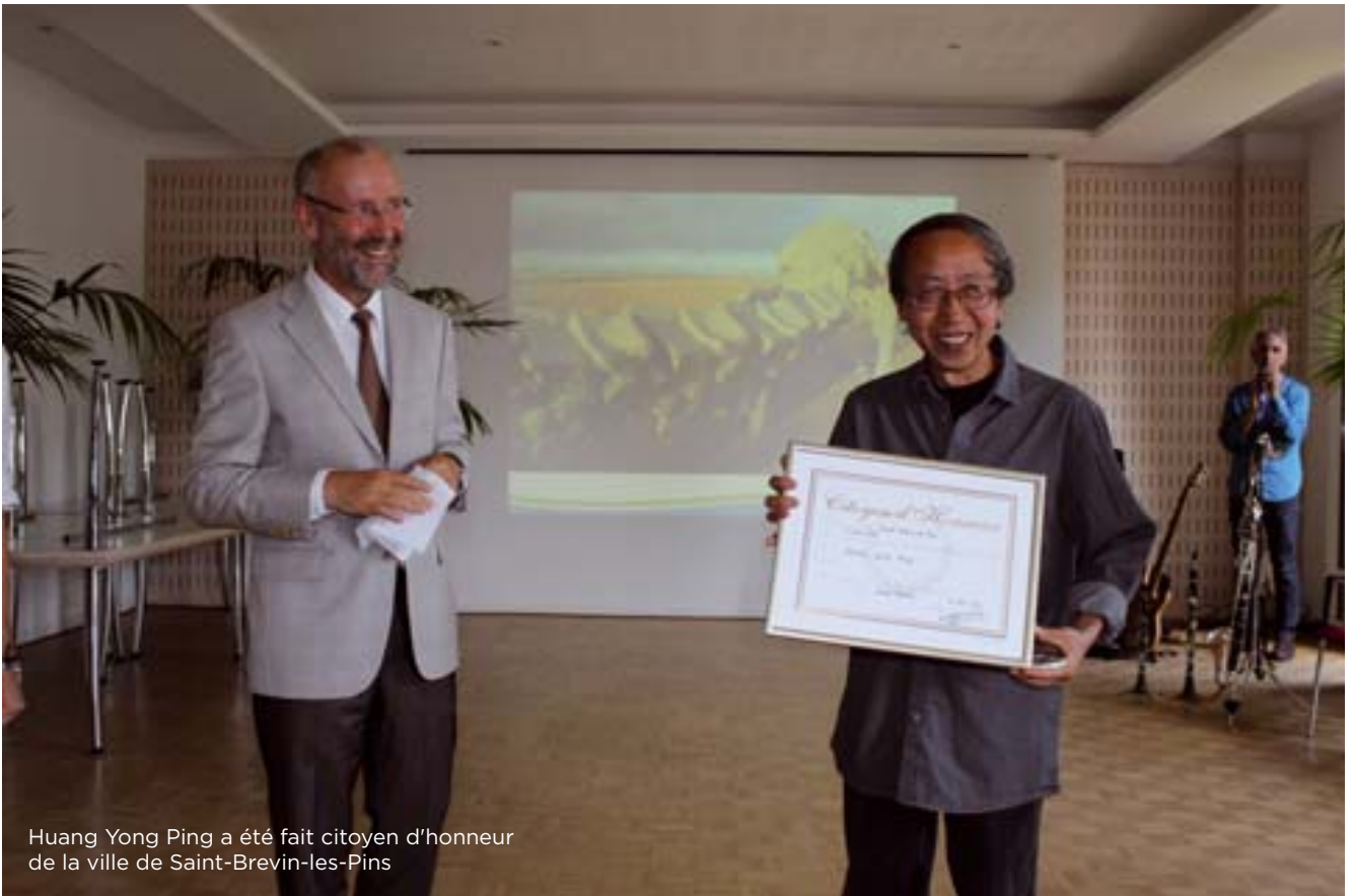
Huang Yong Ping a été fait citoyen d'honneur de la ville de Saint-Brevin-les-Pins