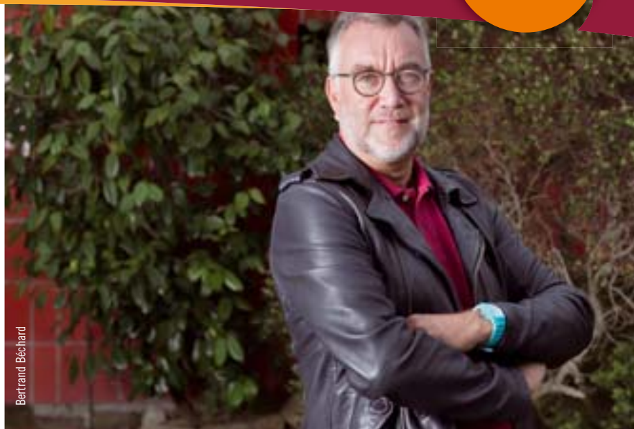
Yannick Morez, Président de la Communauté de Communes Sud Estuaire