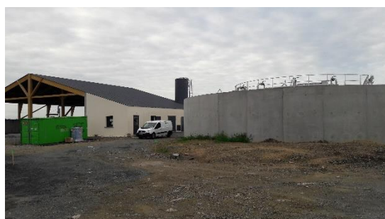
Bassin d'aération (27/08/2020)