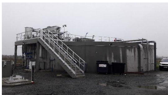
Bassin d'aération (28/01/2021)