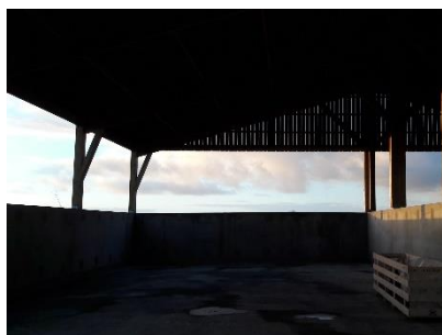
Aire de stockage (17/12/2020)