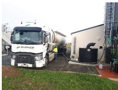
1 er dépotage de chaux (12/01/2021)