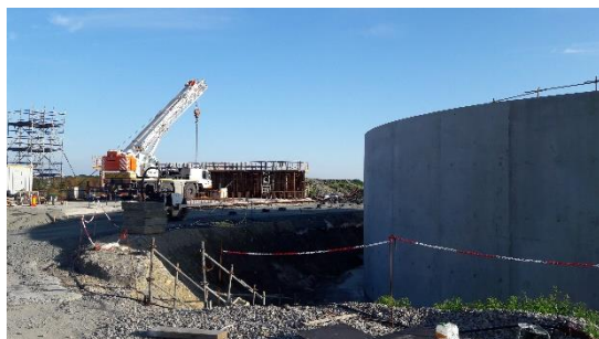
Bassin d'aération (06/05/2020)