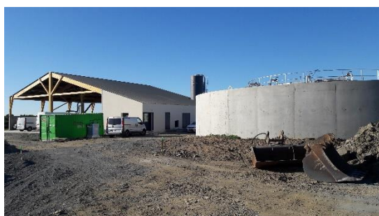
Bassin d'aération (30/07/2020)